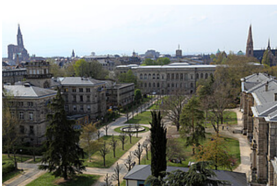
Le Campus historique

Située au carrefour géographique et historique de l'Europe, l' Université de Strasbourg compte parmi les plus importants établissements d'enseignement supérieur et de recherche (ESR) pluridisciplinaires. Grande université de recherche intensive, labellisée depuis 2012 Initiative d'excellence (Idex), elle entretient des liens étroits et privilégiés avec les principaux organismes de recherche, tels le CNRS et l'Inserm. Elle joue un rôle moteur dans la construction de l'espace européen de l'ESR au travers notamment du campus européen EUCOR et de l'alliance universitaire européenne EPICUR. Reconnue pour l'excellence de sa recherche et la richesse de son offre de formation, l' Université de Strasbourg assure sa mission de production et transmission des savoirs et de développement de compétences. S'appuyant sur ses valeurs fondamentales dont l'ouverture, la créativité et l'inclusivité, elle veille à accompagner sa communauté - étudiants et personnels - dans la construction de leur parcours adapté à leur profil, leurs talents et leurs aspirations.